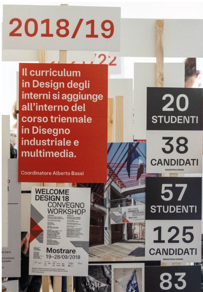
Alive and Kicking. 30 anni di Design Iuav, sala 1, Venezia, 4 - 5 luglio 2024.