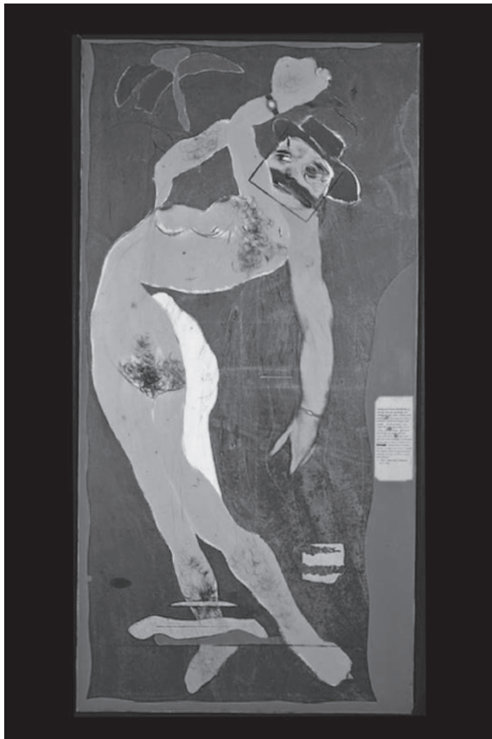
Ronald B. Kitaj, Warburg as Maenad , olio e collage su tela, 92 x 193 cm, 1961-1962, Stiftung Museum Kunstpalast, Düsseldorf. Illustrazione da «La rivista di Engramma», 151, 2017.