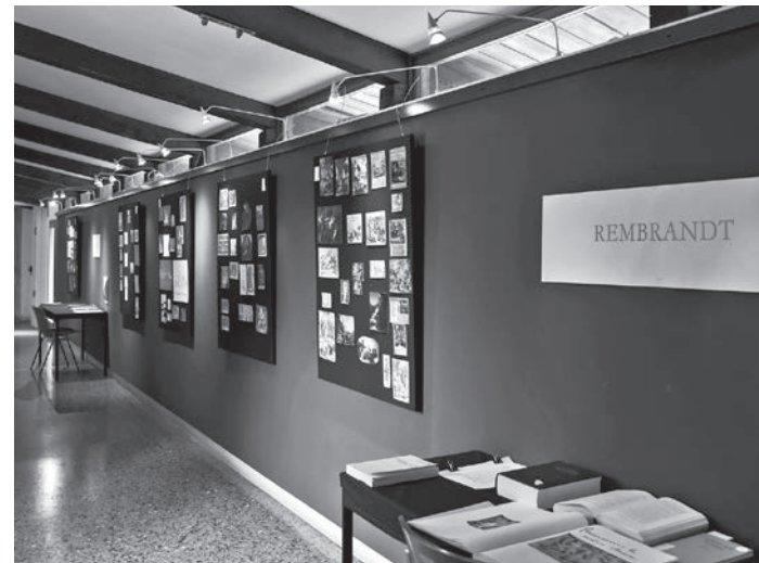
Seminario Mnemosyne, Warburg Manebit! Dürer, Rembrandt, Manet , mostra presso l'Università luav di Venezia, Tolentini, 24 e 27 febbraio 2023, fotografia di I. Grippa. Un'esposizione originale per metodo e per contenuti concentrata su una selezione mirata di Tavole dell'Atlante Mnemosyne di Aby Warburg.