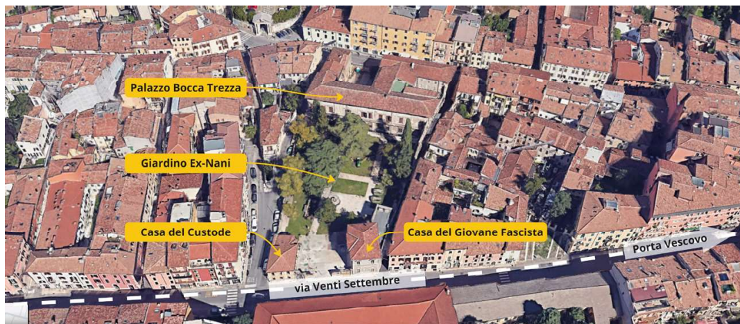
Figura 2: Individuazione di Palazzo Bocca Trezza e degli spazi di pertinenza (elaborazione di Stefania Marini sulla foto aerea di Google Maps, giugno 2024).