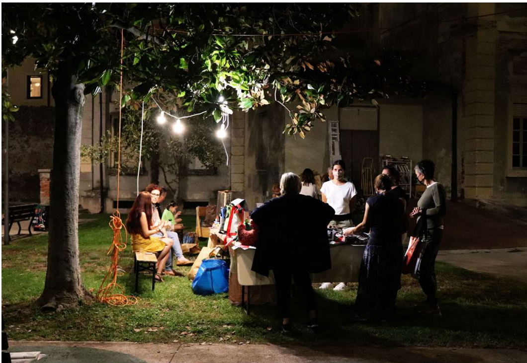
Figura 3: Attività serale nel Giardino Ex-Nani, settembre 2020.

propria pratica. Ciò permette di costruire significati condivisi, rispetto al dialogo con le istituzioni, al valore della cittadinanza attiva e all'importanza della ricerca, necessari a riconoscere l'associazione D-Hub nonché le singole persone che possono darsi una rinnovata identità, trasformandosi da portatrici di bisogni a parte attiva del cambiamento.