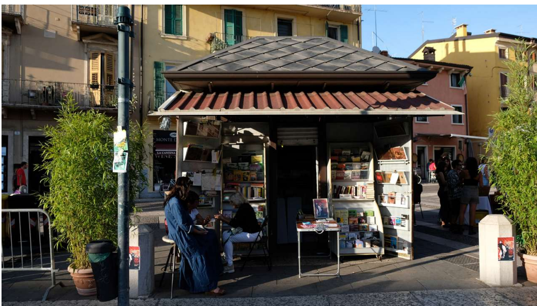
Figura 4: Edicola sociale durante l'evento Festival Veronetta, settembre 2023.