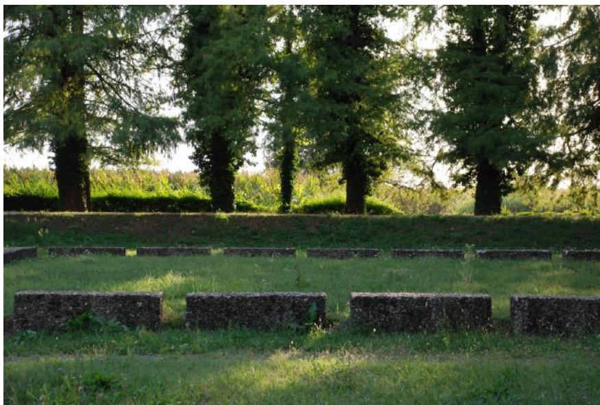
Pietro Porcinai, Memoriale Mattei, Bascapè (Pavia), 1963. Dettaglio del recinto interno.

La vicinanza di Pietro Porcinai ad alcune figure chiave del mondo industriale italiano del dopoguerra è stata in taluni casi suggellata dalla richiesta di dar forma con un progetto di paesaggio a spazi che esprimessero il senso del ricordo, la misura dell'assenza che fa seguito a una prematura scomparsa.