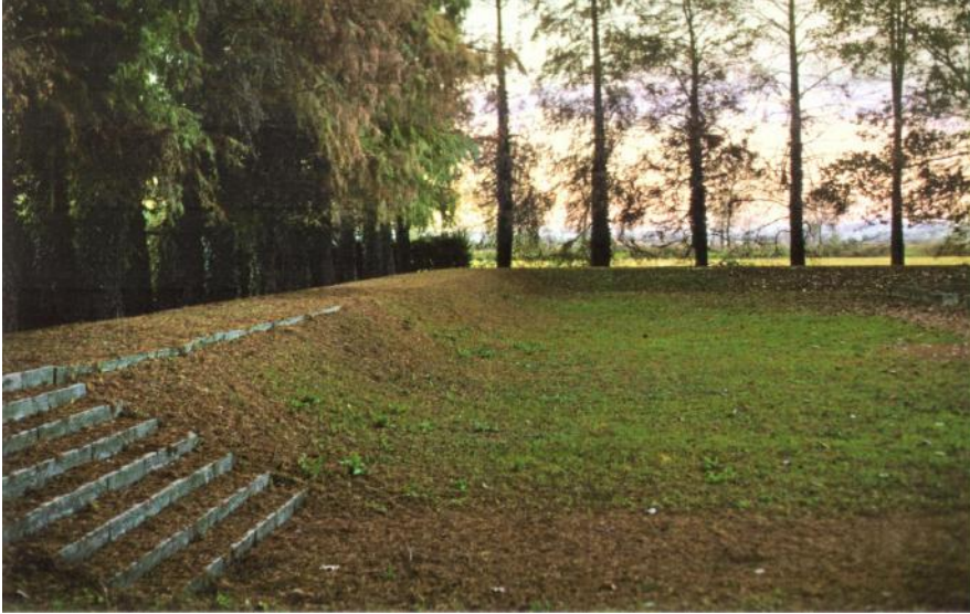
Pietro Porcinai, Memoriale Mattei, Bascapè (Pavia), 1963. L'argine perimetrale in autunno.