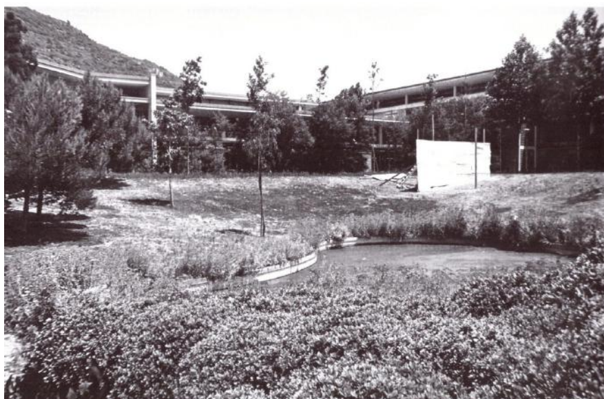
Luigi Cosenza, Memoriale per Adriano Olivetti, fotografia di una prova di simulazione dell'inserimento nel giardino della fabbrica Olivetti a Pozzuoli, opera di Pietro Porcinai.