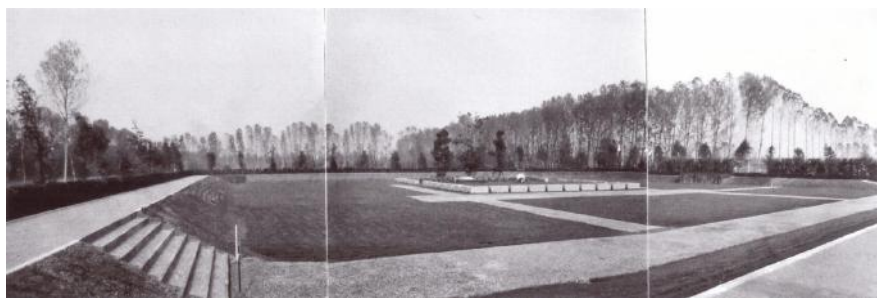
Pietro Porcinai, Memoriale Mattei, Bascapè (Pavia), 1963. Il campo appena inaugurato.

L’argine descrive con la sua figura netta la geometria della pianura coltivata e permette a chi lo percorre in quota, la vista ‘pietosa’ sul campo e la scena che ricorda l’accaduto. Questo artefatto di terra è dunque il confine e al tempo stesso lo spartiacque che segnala il significato della visita: un cammino che si svolge seguendo il doppio registro dello sguardo raccolto sul campo del ricordo e della vista distesa sui campi dove fluisce la vita quotidiana. Tra le molte postazioni visive che nella storia del paesaggio si è costruito, vale la pena salire sulla sommità di una piramide di terra, e ricordare un’iscrizione dettata due secoli prima: “le tombe sono le cime di monti di un nuovo lontano mondo” ( Gräber sind die Bergspitzen einer ferner neuen Welt ) – queste le parole che il barone von Puckler Muskau fa incidere al culmine di una delle sue piramidi a Branitz, nel punto in cui lo sguardo spazia sullo spettacolo della memoria che il nuovo paesaggio progettato ha reso leggibile [8].